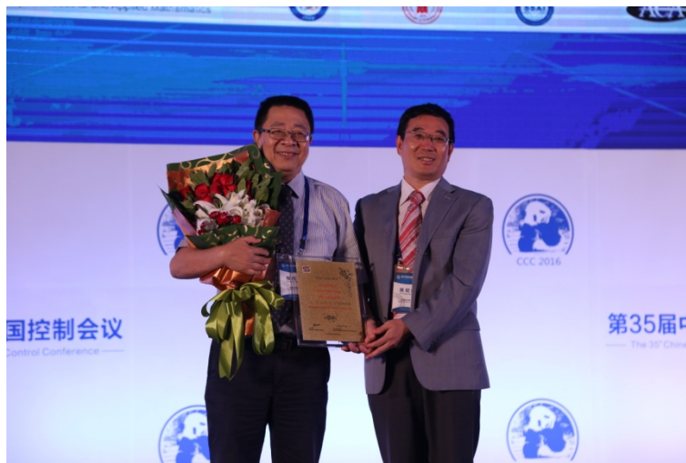
(张纪峰主任在开幕式上为程代展研究员颁奖)

7月27日上午 CCC2016 开幕式在成都国际会议中心五楼水晶厅隆重举行，由大会程序委员会主席香港城市大学陈杰教授主持。西南交通大学校长徐飞教授、大会总主席周克敏教授分别致辞，向大会的召开表示热烈祝贺，向各位代表的到来表示热烈欢迎！随后，在开幕式上举行了第三届陈翰馥奖颁奖仪式。陈翰馥奖评奖委员会主席中国科学院郭雷院士宣布中国科学院数学与系统科学研究院程代展研究员荣获第三届陈翰馥奖。香港中文大学黄捷教授代表评奖委员会介绍获奖人主要学术贡献。程代展研究员在会上发表获奖感言，向评审专家对其科学贡献的肯定表示感谢，并表示将继续为中国控制科学的发展贡献自己的力量！