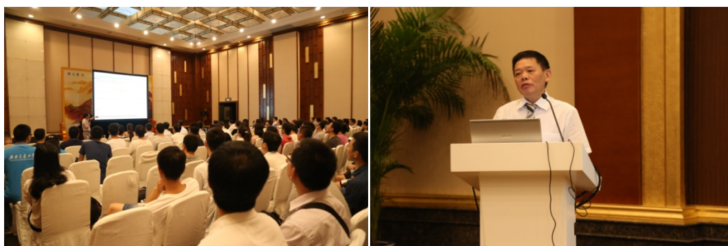
(会前专题讲座照片)